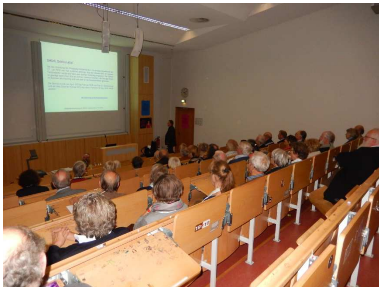
Mitgliederversammlung 2014 der Sektion Kiel der SHUG im Hörsaal der Kieler Fachhochschule.

Nach der Versammlung, die im Hörsaal der FH stattfand, gab es eine kleine Erfrischung und einen Imbiss für die Anwesenden, bevor es zur Vorführung in den Mediendom ging.