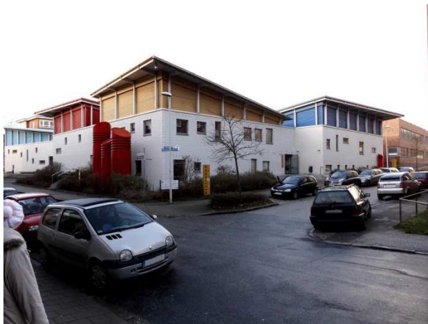
Der Mediendom am Sokratesplatz in Kiel-Dietrichsdorf.